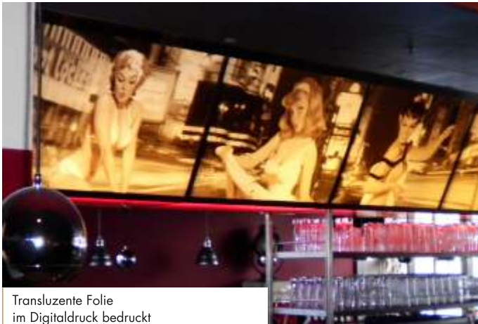
Transuzente Folie im Digitaldruck bedruckt

Durch diese drei Verfahren eröffnen sich unglaublich viele Möglichkeiten, sodass für jedes Objekt eine passende Variante gefunden wird. Der Digitaldruck kommt vor allem dort zum Einsatz, wo besonders fotorealistische und großflächige Werbung erwünscht wird. Beim Siebdruck hingegen erstrahlen die Farben besonders brillant. Kein anderes Verfahren schafft es, solch starke Kontraste und lebendige Farben zu erzielen. Neben dem Digital- und Siebdruck, verarbeiten wir tagtäglich auch Hochleistungsfolien von namhaften Herstellern. Eine Farbbechtheit wird laut Hersteller mit 10 Jahren benannt.