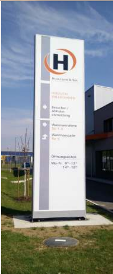
Pylon in gerader Form mit LED-Ausleuchtung

Analysen haben ergeben, dass der Werbepylon mit seiner Funktion als Werbebotschafter hoch in Kurs steht. Hoch stehen Sie auch bei uns mit einer Bauhöhe von bis zu 8 Metern. Darüber hinaus sind Pylone nicht unbedingt der Höhe beschränkt. Mit der richtigen Statik sind schon einige Pylone in anderen Dimensionen erbaut und installiert worden. Zu allererst stellt sich die Frage, welche Bauform der Pylon haben sollte. Dabei gibt es zwei Varianten. Klassische gerade, plane Form und den konvex geformten Korpus. Neben den benannten Bauformen gibt es auch unendlich viele Möglichkeiten, den Pylon zu konfektionieren. Mit Analoguhr für das Zeitgefühl, ein LCD-Werbedisplay mit Ihren Angeboten oder Werbespot, den aktuellen Marktpreis für Ihre Produkte; alles ist bei uns möglich und per Fernwartung realisierbar.