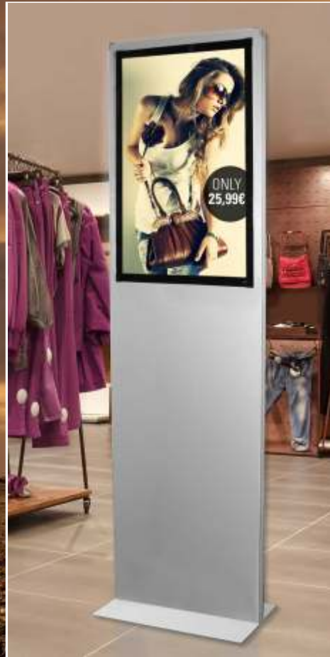
Pylon mit Diakasten für Plakatwechsel in gerader Form und LED-Ausleuchtung