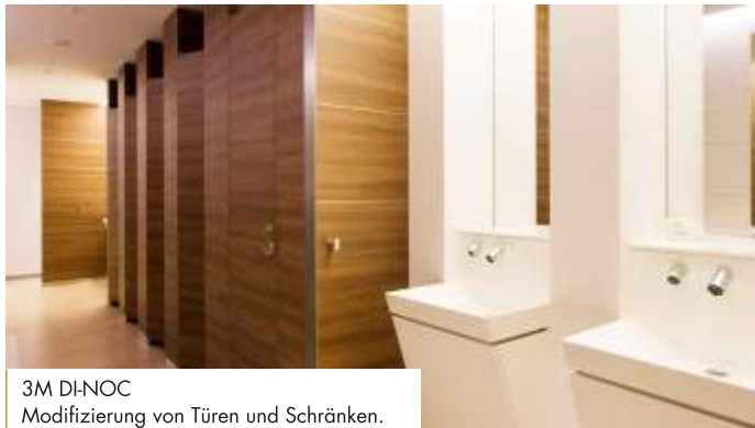
3M DI-NOC Modifizierung von Türen und Schränken.