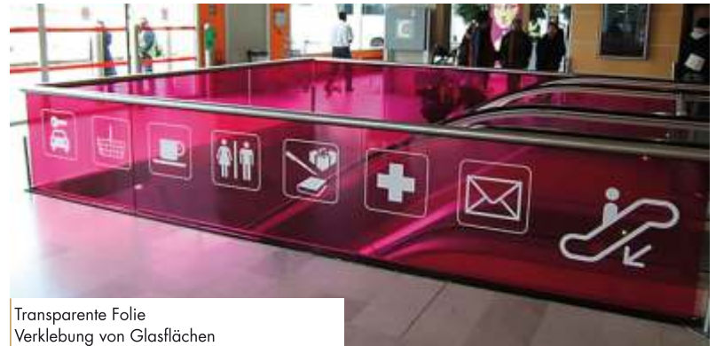
Transparente Folie Verklebung von Glasflächen