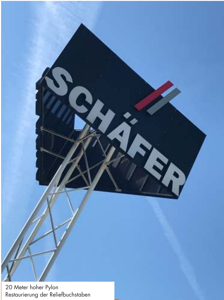
20 Meter hoher Pylon Restaurierung der Reliefbuchstaben