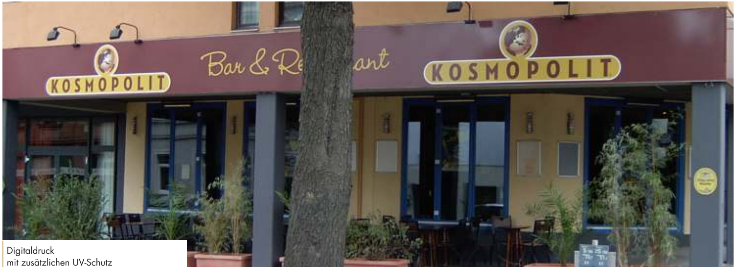
Digitaldruck mit zusätzlichen UV-Schutz