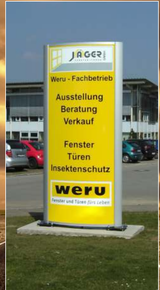
Pylon in konvexer Form mit LED-Ausleuchtung