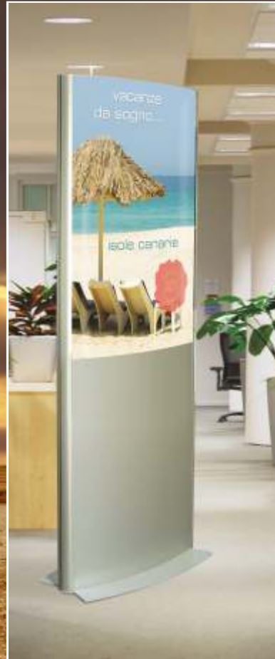
Pylon mit Diakasten für Plakatwechsel konvex geformt und LED-Ausleuchtung