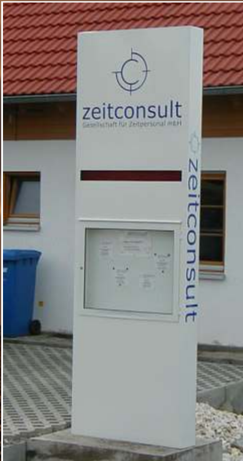
Pylon mit dekupiertem Logo, integrierter LED-Anzeige und Schaukasten