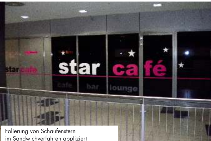
Folierung von Schaufenstern im Sandwichverfahren appliziert